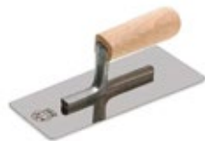
шпатель металлический (кельма)